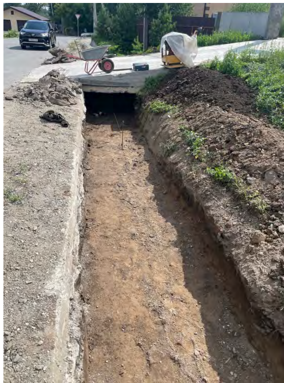
Фото 4. Демонтаж разрушенной части лотка