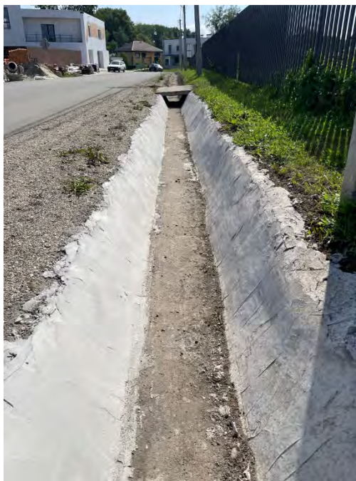
Фото 2. Восстановление стенок лотка