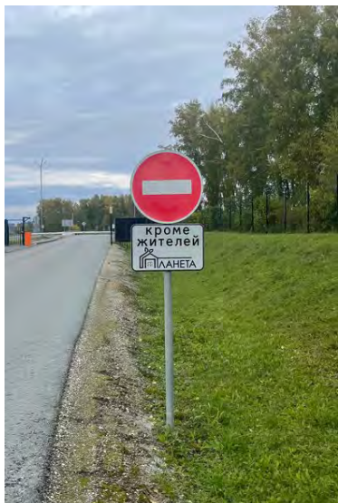
Ранее установленные знаки «кирпич» снабдили знаками дополнительной информации «Кроме жителей Планеты»

Установлены запрещающие знаки на выезде в поле. Кроме того, смонтированы автоматические ворота, преграждающие выезд в поле посторонним лицам. Управление воротами передано сельхозработникам. Они будут самостоятельно регулировать допуск своей техники в поле.