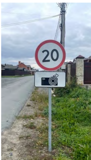
На улицах Озёрная, Светлых надежд, Мечтателей, Лунная, Космическая установили знаки ограничения скорости