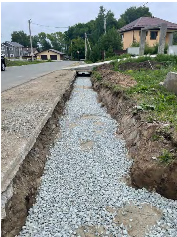
Фото 5. Подготовка основания