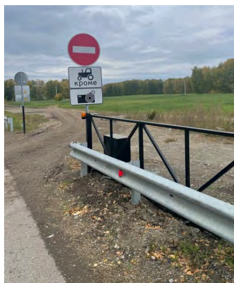
Установили откатные ворота с электроприводом и запрещающие знаки на выезде в поле. Управление воротами у агрономов колхоза.