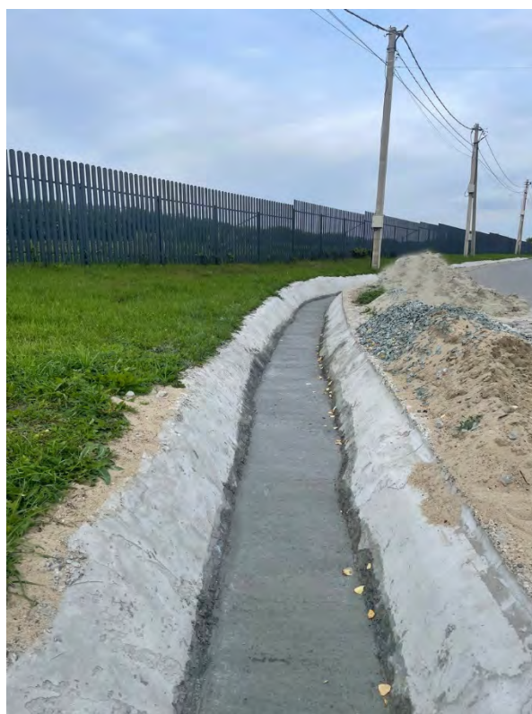
Фото 8. Заливка бетонного дна для лотка