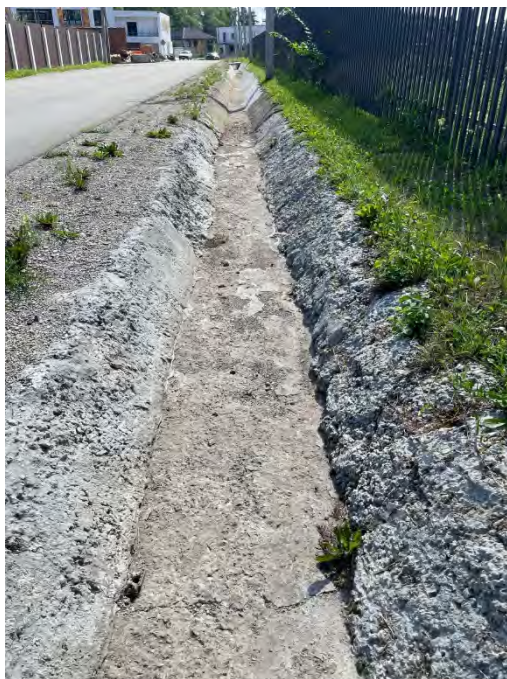
Фото 1. Состояние стенок лотка до ремонта