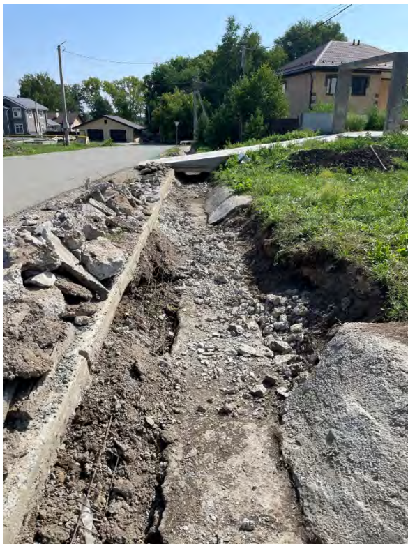
Фото 3. Полное разрушение лотка