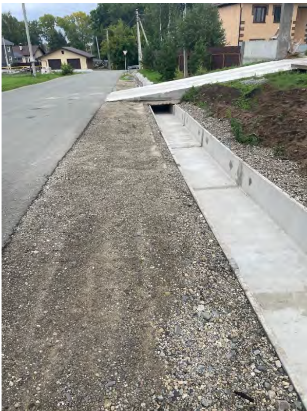
Фото 7. Установлен новый лоток