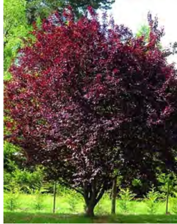
черёмуха Красный шатер